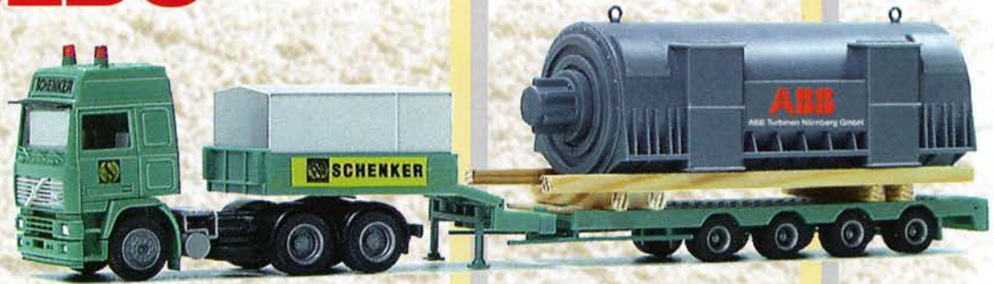
Best.-Nr. 300 173 Volvo F 12 SZ Nooteb. "ABB Turbine" eur 25,05/DM 49,-