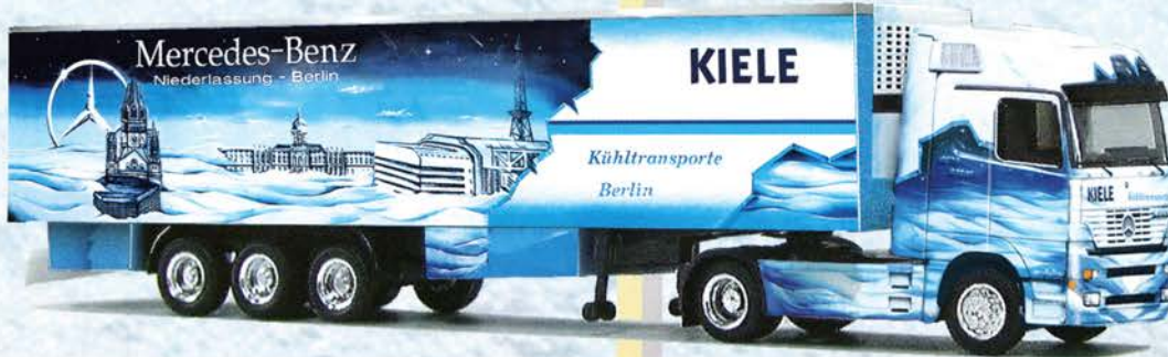
● Best.-Nr. 250 001 MB Actros SZ "Spedition Kiele 1" eur 30,17/DM 59,-