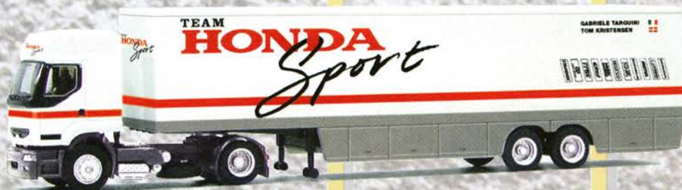
Best.-Nr. 710 032 Renault Premium "Honda Sport" eur 19,94,-/DM 39,-