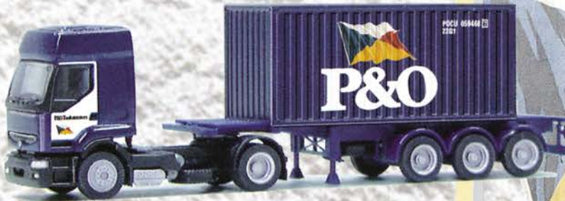
Best.-Nr. 710 030 Renault Prem. SZ "P & O" 20ft. Cont. blau eur 18,41/DM 36,-