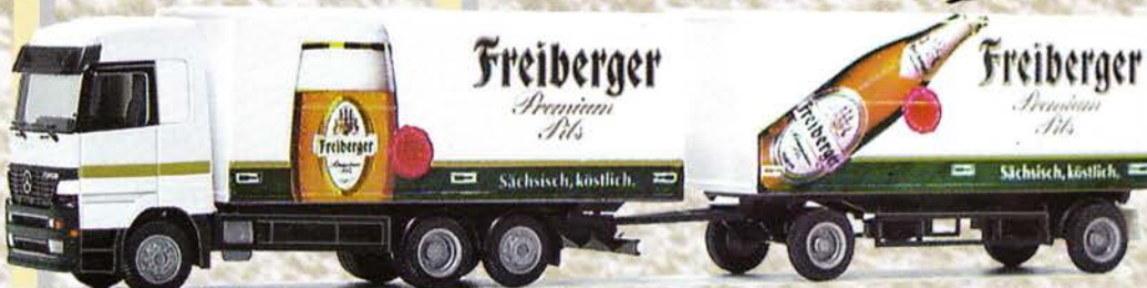
● Best.-Nr. 250 005 MB Actros HZ "Freiberger Pils" eur 21,99/DM 43,-