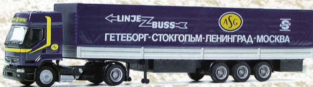
Best.-Nr. 710 029 Renault Premium SZ "ASG" eur 18,41/DM 36,-