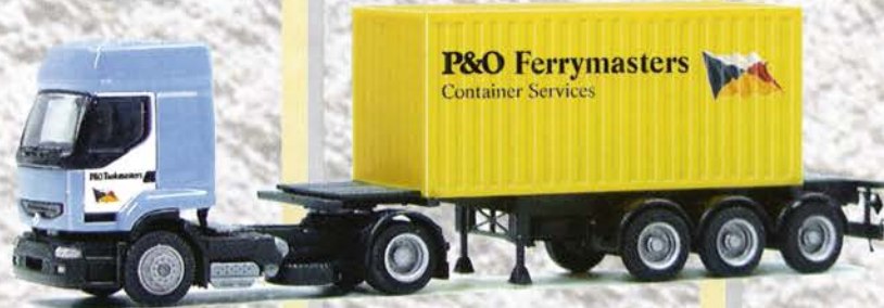
Best.-Nr. 710 031 Renault Prem. SZ "P & O" 20ft. Cont. gelb eur 18,41/DM 36,-