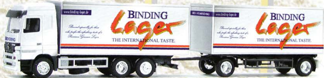
● Best.-Nr. 250 006 MB Actros HZ "Binding Lager" eur 23,01/DM 45,-