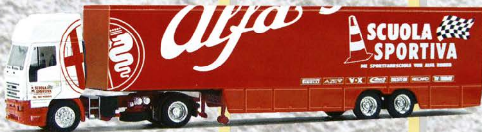
Best.-Nr. 200 381 Iveco SZ "Alfa Rennsport" eur 19,94/DM 39,-