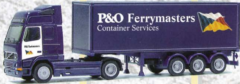
Best.-Nr. 320 068 Volvo XL SZ "P & O" 30ft. Container eur 18,41/DM 36,-