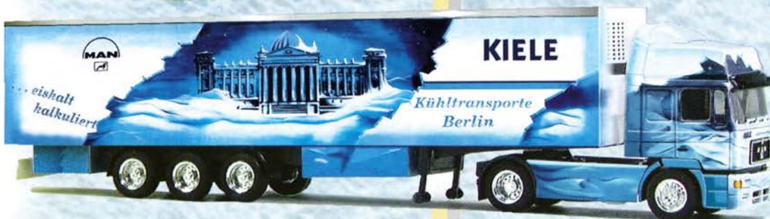
Best.-Nr. 800 052 MAN F 2000 SZ "Spedition Kiele 2" eur 30,17/DM 59,-