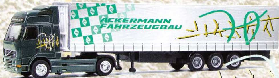
Best.-Nr. 320 063 Volvo XL SZ "Ackermann Fahrzeugbau" eur 19,94/DM 39,-