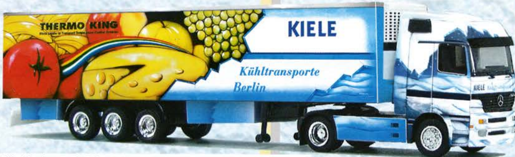
● Best.-Nr. 250 002 MB Actros SZ "Spedition Kiele Obst" eur 30,17/DM 59,-