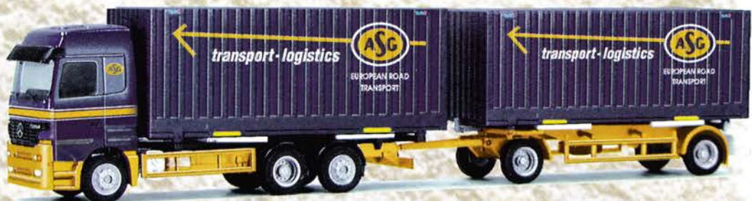
● Best.-Nr. 250 008 MB Actros HZ "ASG" Tulo Box eur 19,94/DM 39,-