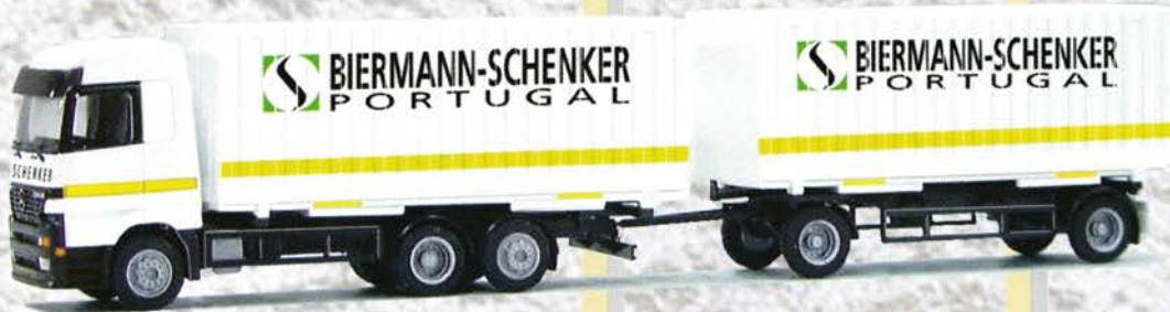
● Best.-Nr. 250 012 MB Actros "Biermann Schenker Portug." eur 19,94/DM 39,-