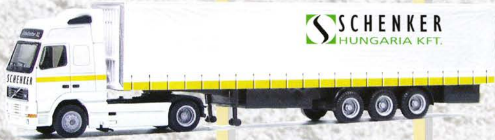
Best.-Nr. 320 071 Volvo SZ "Schenker Hungaria KFT." eur 18,41/DM 36,-