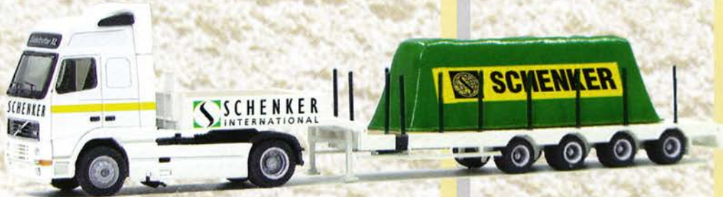
Best.-Nr. 320 065 Volvo XL SZ Nooteboom "Schenker" eur 21,99/DM 43,-