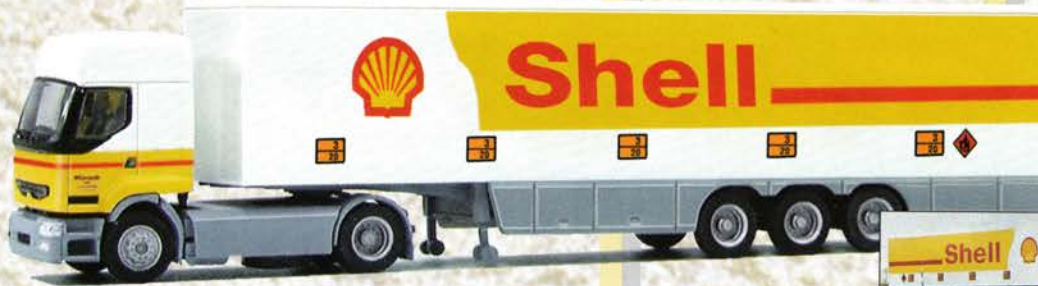
Best.-Nr. 710 028 Renault Prem. SZ "Shell/Sped. K rdel" eur 21,99/DM 43,-