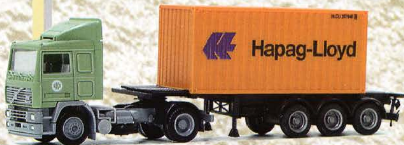
Best.-Nr. 300 174 Volvo F 12 SZ "Hapag Lloyd" 20ft. Cont. eur 18,41/DM 36,-