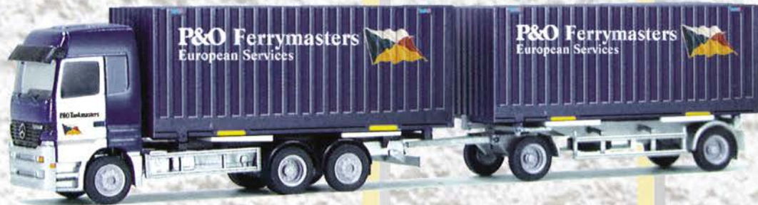
● Best.-Nr. 250 009 MB Actros HZ "P & O Tulo Box" eur 21,99/DM 43,-