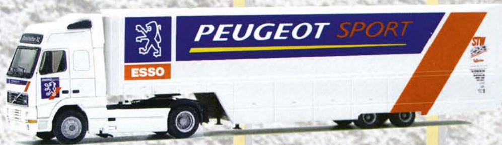
Best.-Nr. 320 069 Volvo XL SZ "Peugeot Rennsport" eur 19,94/DM 39,-