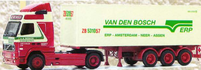
Best.-Nr. 320 067 Volvo FH SZ "Van den Bosch" 30ft. Cont. eur 18,41/DM 36,-