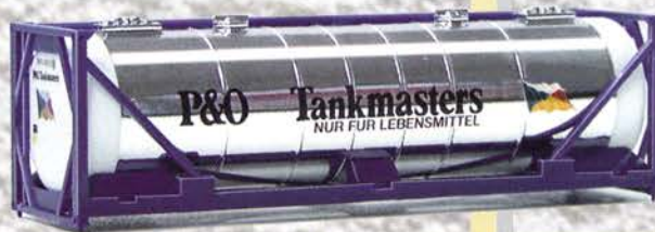
Best.-Nr. 500 165 30ft. Tankcontainer verchromt "P & O" eur 7,41/DM 14,50