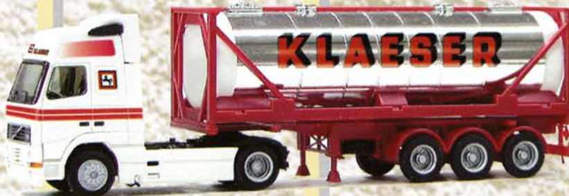
Best.-Nr. 320 066 Volvo XL SZ "Klaeser" 30ft. Tankcont. verchromt eur 18,41/DM 36,-